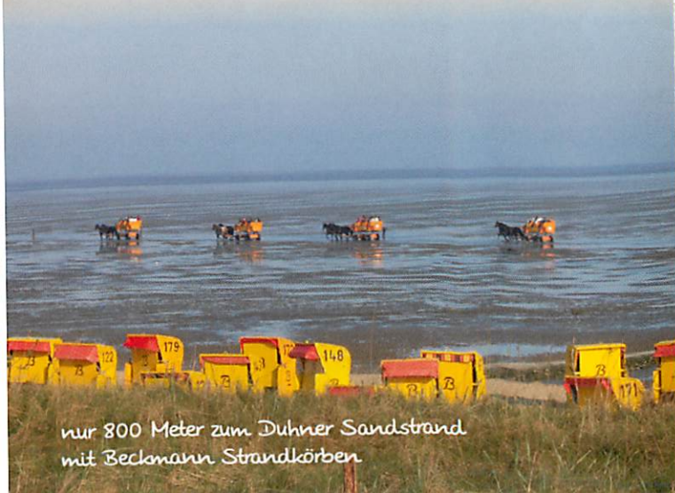
nur 800 Meter zum Duhner Sandstrand mit Beckmann Strandkörben

Der Campingplatz ist idealer Ausgangspunkt für Fahrradtouren zu den benachbarten Kurteilen Sahlenburg, Döse, der Grimmershörnbucht und dem Hafen mit seinen maritimen Sehenswürdigkeiten.